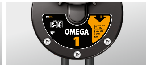
Рис. 2 Трудноудаляемая этикетка.