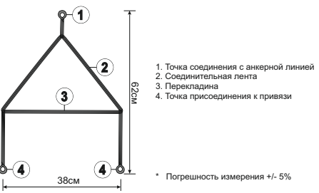
Рис. 3. Совместимое оборудование