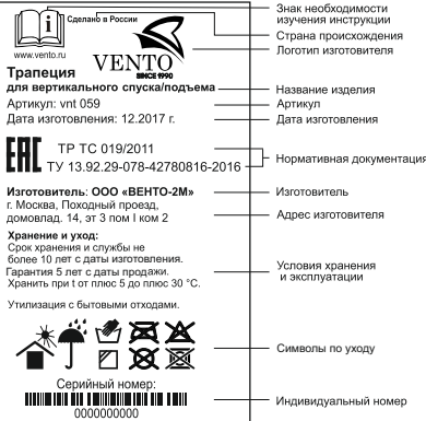
Рис. 1. Маркировка изделия

Перед использованием данного СИЗ Вы обязаны: - Прочитать и познать инструкцию по эксплуатации. - Пройти тренировку по его применению под руководством квалифицированного инструктора. - Познакомиться с потенциальными возможностями и ограничениями по его применению. - Осознать и принять вероятность возникновения рисков, связанных с применением СИЗ. Игнорирование этих предупреждений может привести к серьезным травмам или даже смерти.